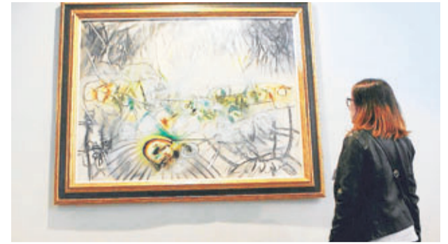
►► Oleo de Roberto Matta, de 1951, a la venta.