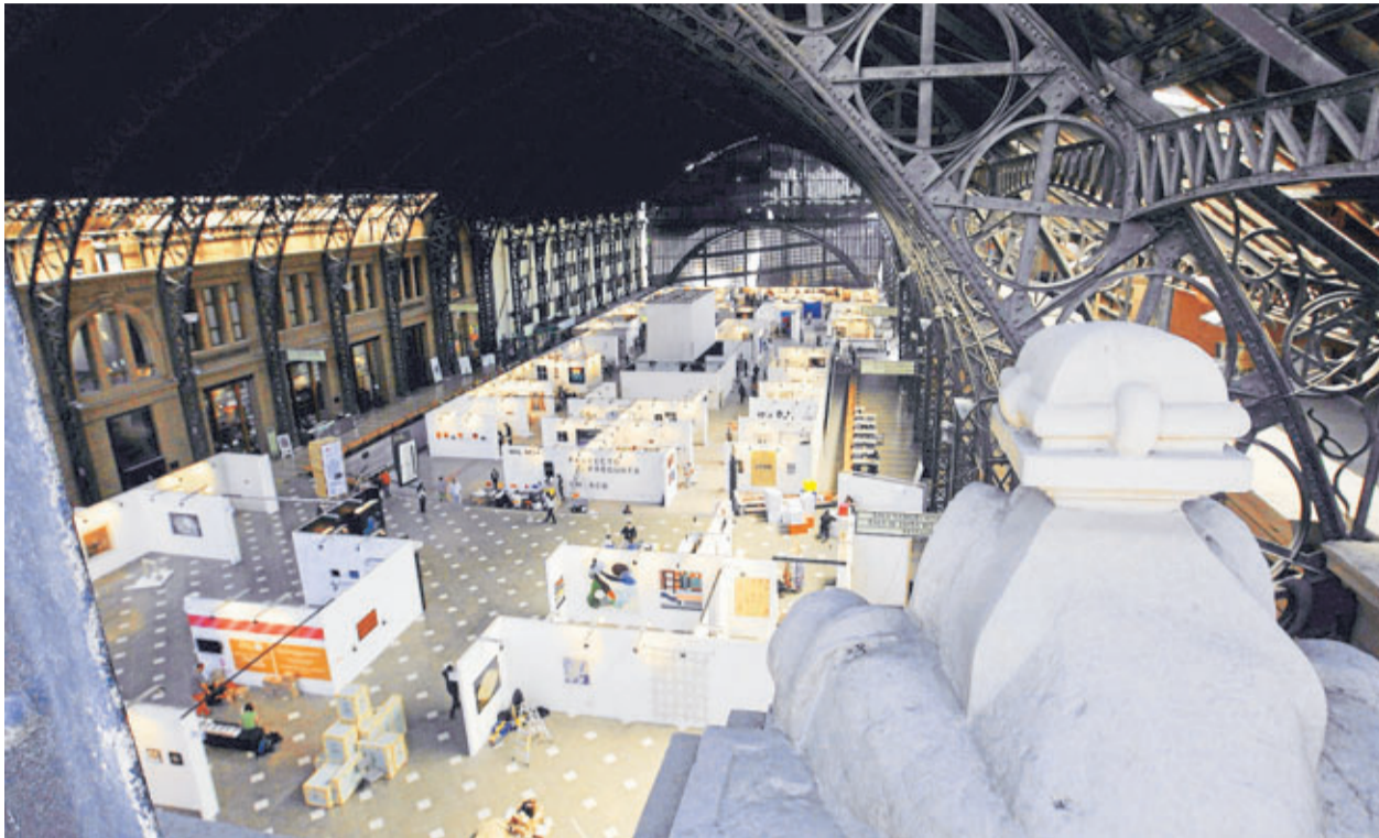
►► La Estación Mapocho, a un día de la apertura de la feria, abierta hasta el domingo.

Abierta del 3 al 5 de octubre en la Estación Mapocho, de 12 a 21 horas. Entradas: general, $ 6000; tercera edad y estudiantes, $ 3.000. Menores de 10 años no pagan. Más datos en: www.feriachaco.cl .