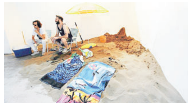
►► Arte en vivo: esculturas de arena en galería Local.